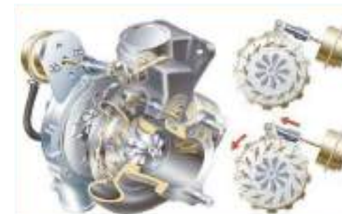
1 Turbo de geometría variable

Cuenta con un sistema de frenos de aire con ABS, que brinda un óptimo control del vehículo y garantiza mayor seguridad al momento de frenar.