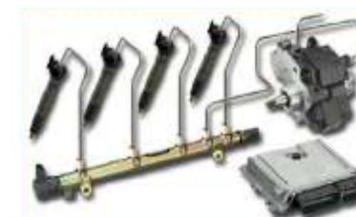
Inyección Common Rail